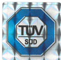
Vedoucí certifikačního orgánu